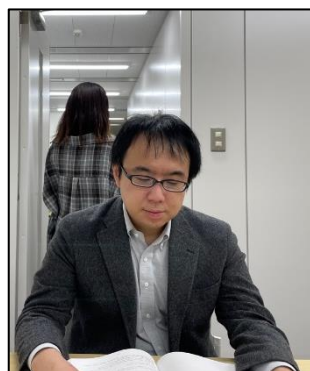
第三者の映り込み (過失・故意問わず)