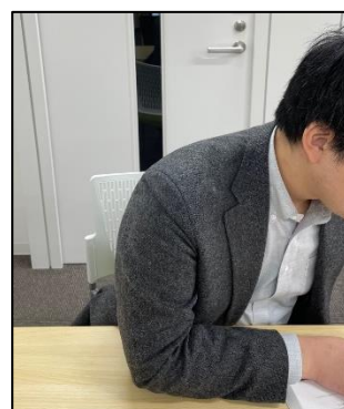
顔全体が 映っていない