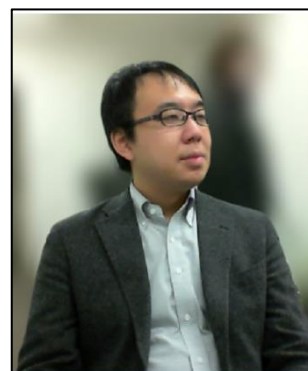
ぼかし・バーチャル 背景の使用