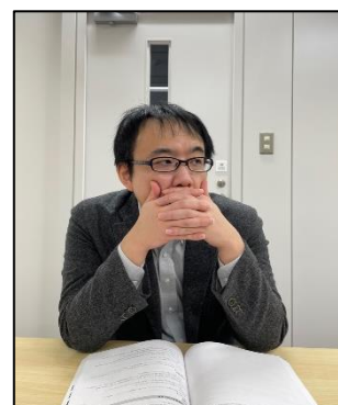
口元を故意に隠す