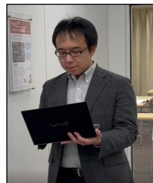
移動しながらの受講